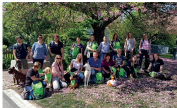
Teilnehmer bei der Rucksackübergabe am 28. April im GügeliSternen, Küsnacht.