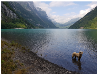
Badeplausch am See

Mit dem Postauto bis nach Station „Plätz“ gefahren, führt uns diese Wanderung die ersten Minuten dem renaturierten Waldstück entlang der Klön (Glernerdeutsch „Chlüü“). Anschliessend zeigt sich der wunderbare Klöntalersee auf der ganzen Wanderung immer wieder von seiner schönsten Seite. Je nach Wasserstand des Sees bietet dieser wunderbare Ort genügend Plätze welche immer wieder zum Grillieren und Verweilen einladen. Eine Engstelle gibt es beim „Bärentritt“. Vom Ruhebänklein an bester Aussichtslage sieht man besonders schön, wie sich an ruhigen Tagen oder früh am Morgen die Berge im See spiegeln. Vorbei am Campingplatz führt uns der restliche Weg nach Riedern entlang dem „Löntschi“ Bach auf dem Waldweg. Perfekt für heisse Sommertage, gibt es auch hier genügend Möglichkeiten sich am Wasser zu erfrischen. Als krönender Abschluss lädt die Feuerstelle kurz vor Riedern nochmals ein innezuhalten und die wunderbaren Impressionen der heutigen Tour Revue passieren zu lassen. Wer möchte kann bis zum Bahnhof Glarus laufen oder nimmt ab Riedern „Schulhaus“ wieder das Postauto zum Bahnhof.