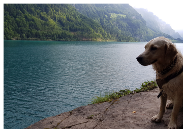
Aussicht vom „Bärentritt“